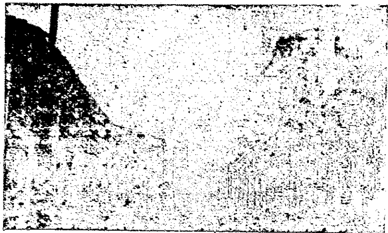
Chitré.—Una calle en la cual está interesada la Municipalidad.