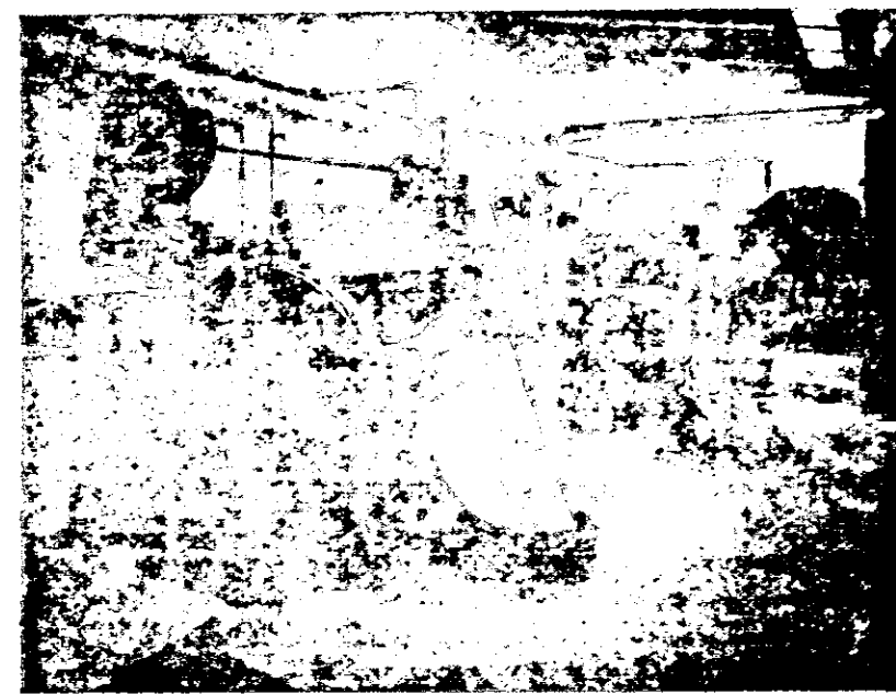
Paramá.—Fábrica de vestidos para hombres "El Corte Inglés", esta fotografía presenta uno de los diferentes departamentos de esta fábrica